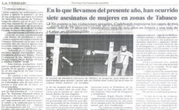
La verdad del sureste

en general (hombres y mujeres) cometidos durante el 2006 sólo se había resuelto el 62% de los casos. De este total de casos 10 son de crímenes contra mujeres de los cuales el 80% tienen como primera línea de investigación por parte de la policía judicial asuntos pasionales, y de éstos solo se han resuelto tres casos siete continúan impunes.*